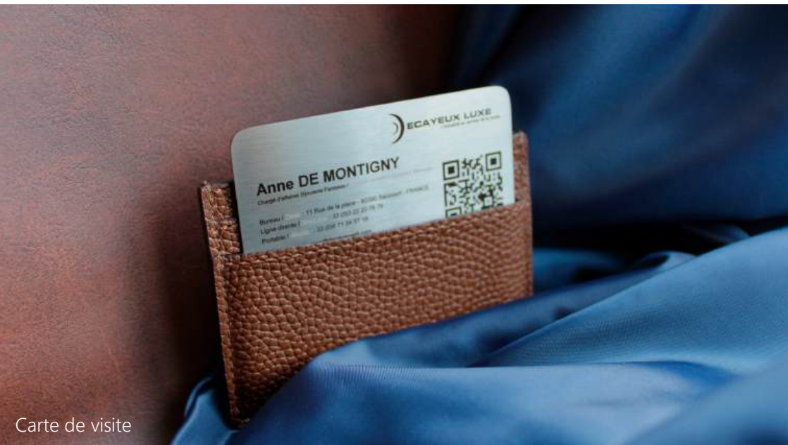
Carte de visite

Alliez tradition et modernité avec notre coupe-papier élégant et fonctionnel, et nos cartes de visite innovantes avec QR code pour une connectivité instantanée.