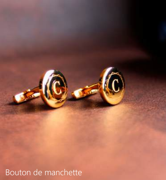
Bouton de manchette